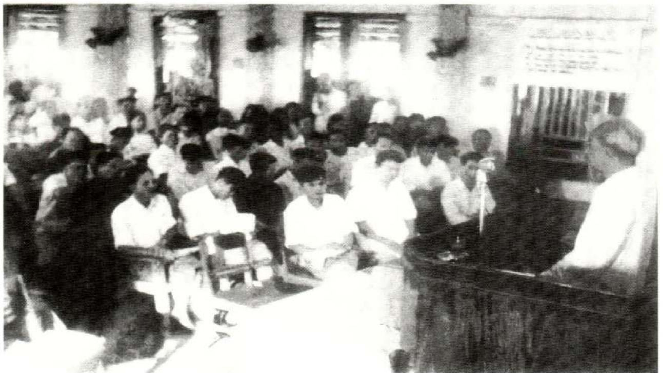
Bác Hồ thăm và nói chuyện tại Đại hội Đại biểu Công đoàn tỉnh Thanh Hóa lần thứ VI, ngày 19/7/1960. Bác căn dặn: “Nước ta là nước nông nghiệp..., muốn phát triển công nghiệp, phát triển kinh tế nói chung phải lấy nông nghiệp làm gốc, làm chính. Nếu không phát triển nông nghiệp thì không có cơ sở phát triển công nghiệp vì nông nghiệp cung cấp nguyên liệu, lương thực cho công nghiệp và tiêu thụ hàng hóa của công nghiệp làm ra...”