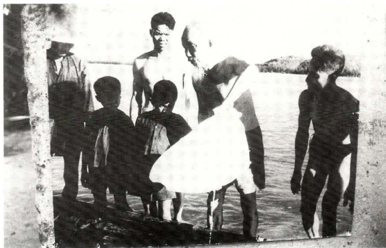
Bác Hồ cùng thu lưới và chung vui với sản phẩm thu được của ngư dân xóm Sơn, xã Quảng Vinh, huyện Quảng Xương, nay là khu phố Vinh Sơn, phường Trường Sơn, thị xã Sầm Sơn, ngày 18/7/1960