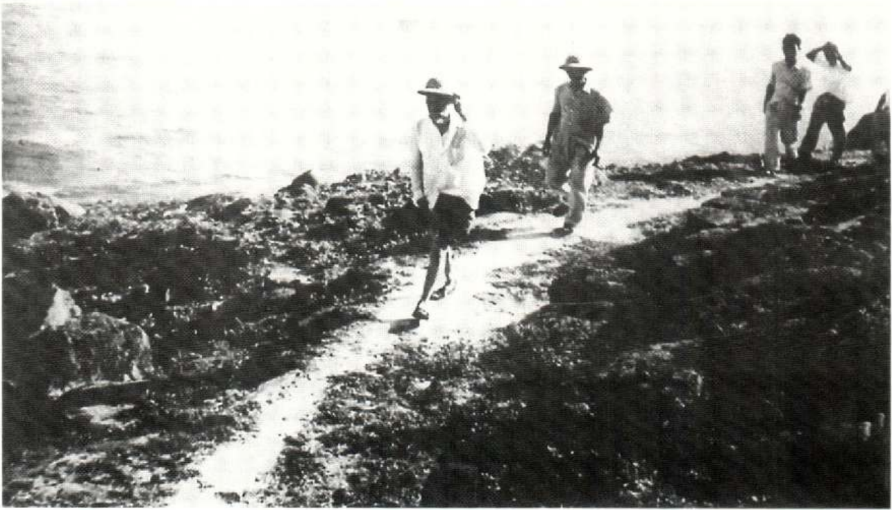
Bác Hồ tham quan núi Trường Lệ, Sầm Sơn, Thanh Hóa, ngày 18/7/1960