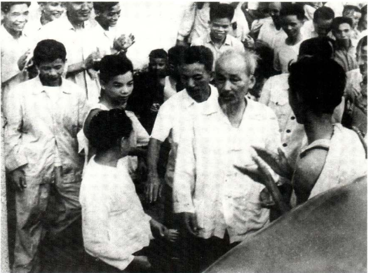
Bác Hồ nói chuyện với cán bộ, công nhân viên và khách nghỉ dưỡng tại Nhà nghỉ dưỡng Sầm Sơn, ngày 18/7/1960