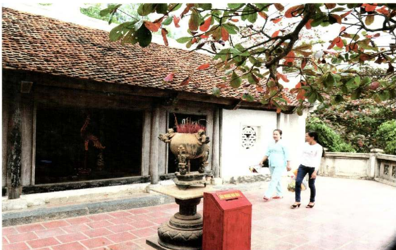
Dền Cô Tiên trên núi Trường Lệ, thị xã Sầm Sơn - nơi Bác Hồ nghỉ trong thời gian về thăm Thanh Hóa, tháng 7 năm 1960

“Nếu nơi đây có một hệ thống du lịch khách sạn và có phương tiện đưa đón khách nghỉ mát để tới hòn Mê thì sẽ thu được nhiều của cải từ đây”