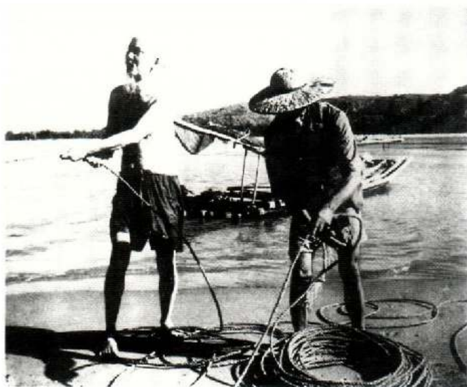
Bác Hồ nói chuyện và kéo lưới cùng ngư dân xóm Sơn, xã Quảng Vinh, huyện Quảng Xương (nay thuộc khu phố Vinh Sơn, phường Trường Sơn, thị xã Sầm Sơn), ngày 18/7/1960